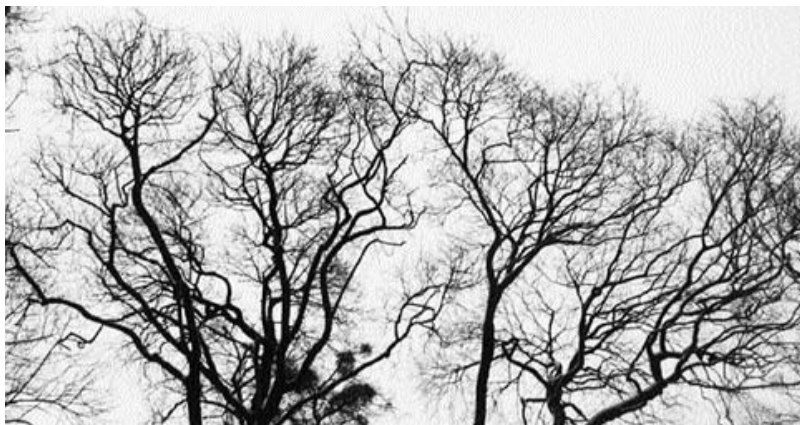
Уже не осінь. І ще не весна