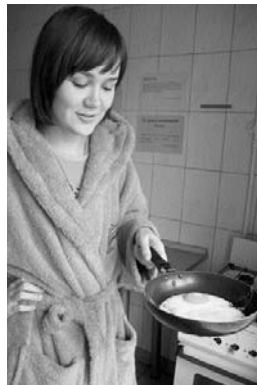
А їсти хочеться завжди