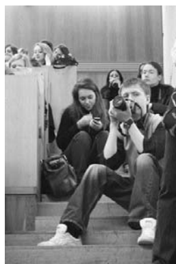
Кожен знаходить своє місце

Тому День студента — це студентський день. Ми із задоволенням ним поділимося з абітурієнтами підфанку, з учнями курсів крою та шиття. З кожним, хто є студентом у душі. Єдине: зайти до сусідньої кімнати і наперед вибачитись перед сусідкою-п'ятикурсницею, якої завтра прокидається о шостій.