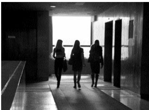
Тільки вони знають свій шлях