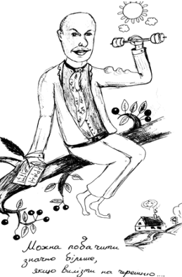
Можна подати знання більше, якщо вийти на зрешто...

Інна Ніколайчук. Чомусь вважає, що знання видавничої проблематики, редакторські вміння — зайві, оскільки вабить тележурналістика.