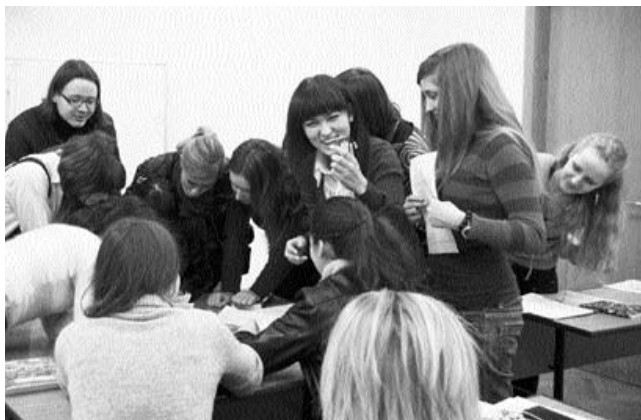
Ще мені поставте