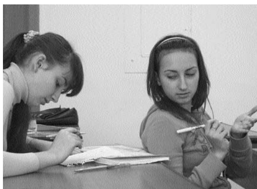
Поділись із подругою